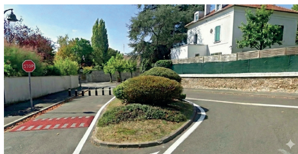
Illustration à visée prospective — ne constitue ni un plan technique ni un engagement sur la disposition finale des installations.

Concrètement ? Chaque matin, des dizaines de collégiens traversent le croisement rue des Rosiers / boulevard Hayem en trottinette, sans respecter le stop. Les automobilistes freinent in extremis. Demain, ce croisement — et tous les points noirs des trajets vers les collèges — sera identifié, signalé et sécurisé. Parce que la sécurité de nos enfants ne peut pas attendre un accident pour devenir un pilier.