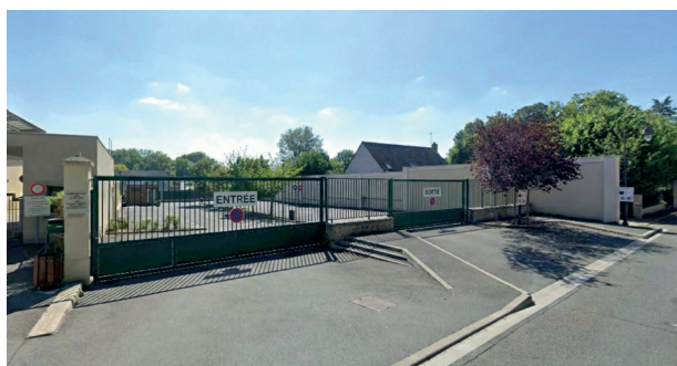
Illustrations à visée prospective — ne constitue ni un plan technique ni un engagement sur la disposition finale des installations.